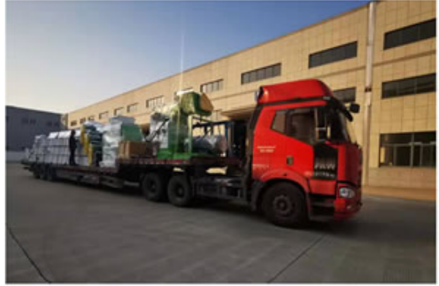
云南某客户688生物质颗粒机成套