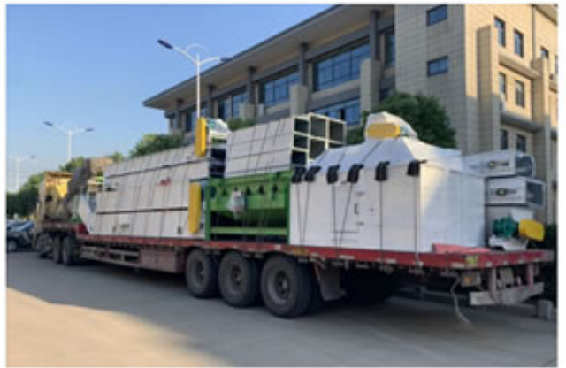
山西某客户688生物质颗粒机成套